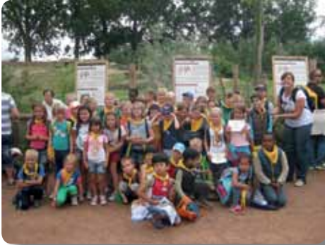
Met de jeugddienst naar Pairi Daiza