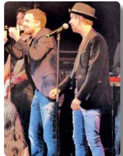
Zomaar een zomeravond met Cleymans & Van Geel